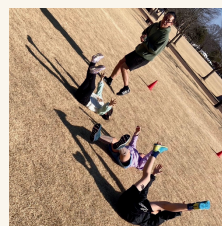
体幹トレーニング

赤ちゃんが生まれてから 立ち上がるまでの、 発育発達をエクササイズにした、 体幹トレーニング