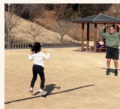
リズムトレーニング

赤ちゃんが生まれてから 立ち上がるまでの、 発育発達をエクササイズにした、 体幹トレーニング